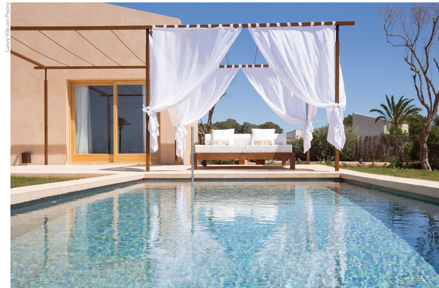
Luxury Villa con Piscina